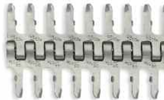
Соединения Alligator® Lacing размера 65