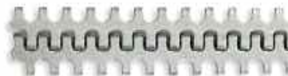
Соединения Alligator® Lacing размера 00

Для плоских приводных ремней толщиной до 300 мм. Материал для сшивания имеет рифление и может отделяться для соответствия лентам с шириной менее указанной на упаковке.