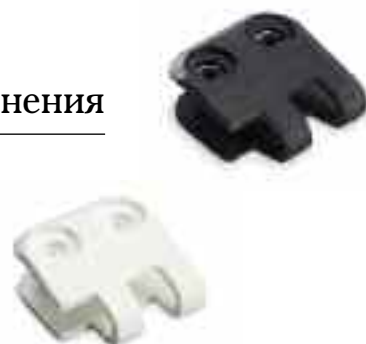
Таблица для выбора системы крепления с пластиковыми заклепками Alligator®

Устойчивый к УФ-излучению черный цвет увеличивает срок службы на открытом воздухе. Белый пластик, одобренный Управлением по контролю за продуктами и лекарствами (FDA), защищает от воздействия слабых растворов кислот, щелочей, углеводов, эфирных растворов и спиртов. Оба материала можно использовать при температурах от -20^{\circ}\text{F} до 180^{\circ}\text{F} ( -29^{\circ}\text{C} до 82^{\circ}\text{C} ).