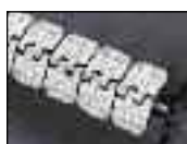
Система скобового крепления Alligator® Ready Set™ Стр. 4–9